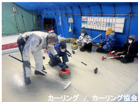
カーリング / カーリング協会

なんでもスポーツクラブは3年生以上の小学生を対象とした毎年人気のクラブです。年間を通じて多種目のスポーツを体験することができ、種目ごとに市内競技団体による専門指導が受けられます。運動が得意な子どもだけでなく、運動が苦手な子どもも参加しやすく楽しめる教室となっており、今年度もバスケットボールやバドミントンをはじめ全8種目のスポーツに親しみました。