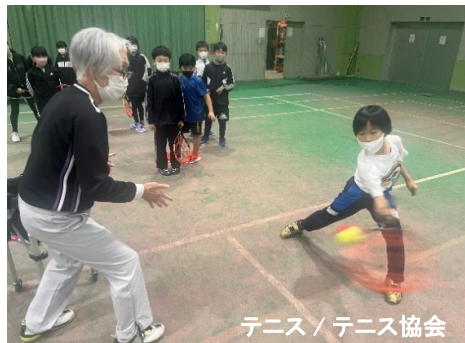
テニス / テニス協会