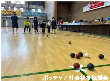
ポッチャ / 社会福祉協議会

開催日 令和4年6月～令和5年2月 会場 市内各スポーツ施設（総合体育館等） 参加者 会員 25名（延べ参加者数292名）