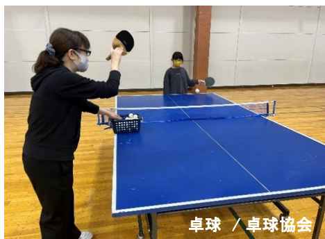
卓球 / 卓球協会