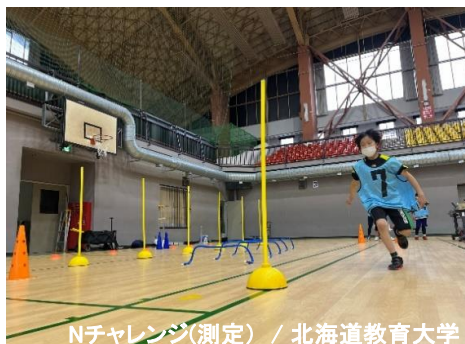
Nチャレンジ(測定) / 北海道教育大学