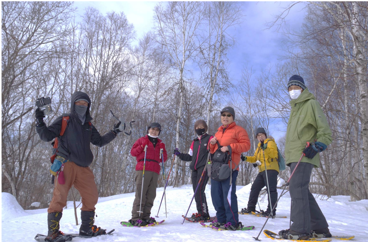
▲士別中央スポーツクラブ事業 木曜ラッセルスノーシュークラブ