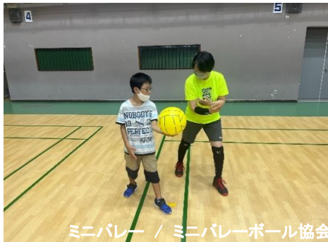
ミニバレー / ミニバレーボール協会