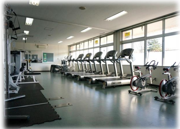
トレッドミル 4台・クロストレーナー 2台 ライフサイクル 2台・チェストプレス 1台・他