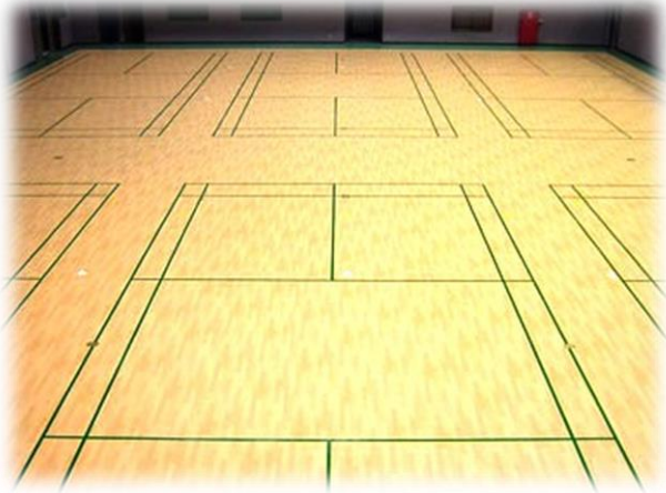
床：タラフレックス