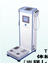
TANITA社製 体組成計 導入 (※詳しくは事務室まで)